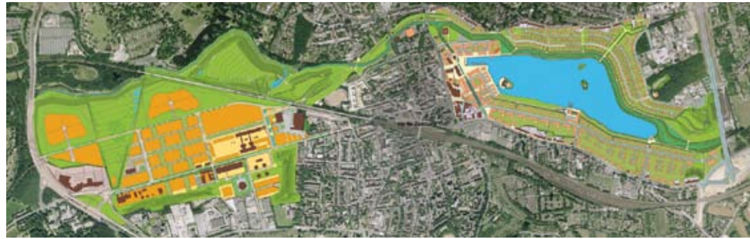
Entwurf: stegemeier Architektur und Stadtplanung / Stadt Dortmund